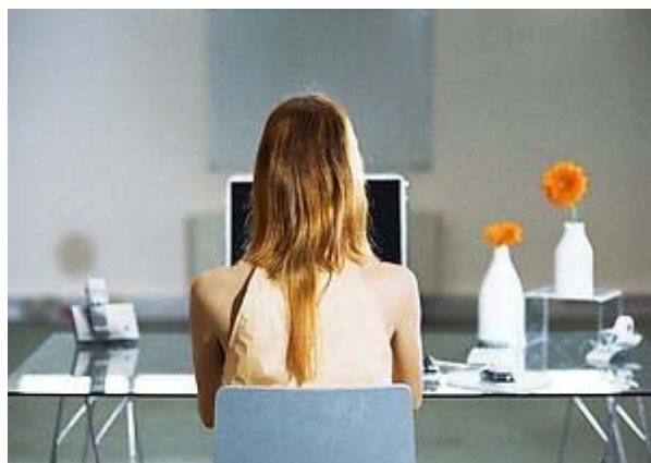
Der Schreibtisch der Zukunft ist frei von persönlichen Dingen

Freitag 22.10.2010, 12:05 · von FOCUS-Online-Autorin Nadine Nöhmaier