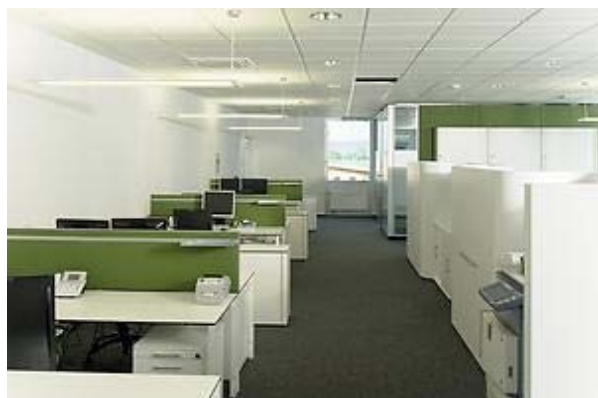
Architektur: Partner AG Großraum mit Rückzugsmöglichkeit: So sehen Büros aus, die heute gebaut werden

Es klingt ausgesprochen gewöhnlich: Doch wer in der Hierarchie weit oben steht, wird auch in Zukunft im Einzelbüro sitzen – egal, wie innovativ die Bürolandschaft um ihn herum auch organisiert sein mag. Schließlich finden im Zimmer des Chefs Personalgespräche und strategische Beratungen statt – und die wird es auch weiterhin nur hinter verschlossenen Türen geben.